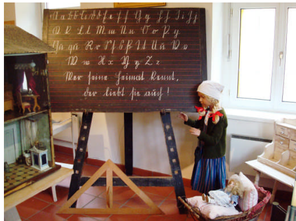
im Heimatmuseum wurde man durch die reiche Geschichte von Bad Hall und ihrer Gesundbrunnen geführt