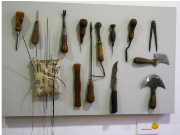
Im Handwerkermuseum wurde uns einiges über die vielen „Zünfte“ des damaligen Ortes erzählt