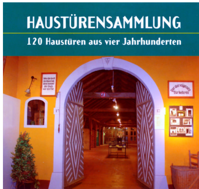
Jede Haustüre hat „ihre Geschichte“

Anschließend stand eine Wanderung im Kurpark auf dem Programm. Dort besichtigten wir die Sonderausstellung „Fauna in Metall“. 51 europäische Künstler schmiedeten vom Aussterben bedrohte Tiere aus Eisen, Kupfer und Edelmetall. Die umfangreiche Schau der Metallplastiken war beachtenswert. Man kann sich vorstellen, wie schwierig die Verformung von Eisen- oder Blechteilen zu bestimmten Tierkörpern sein muss. Diese Tierkörper sind auf dem großen Areal des Kurparks verteilt und regten zur Umrundung des Geländes und zu einem erlebnisreichen Spaziergang an.