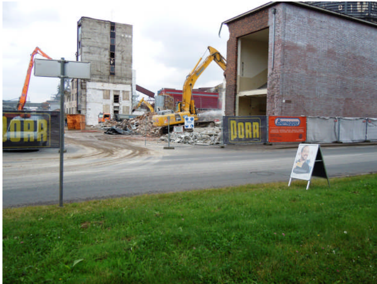
Das BG 01 wird nach 70 Jahren abgetragen (21.10.2010)